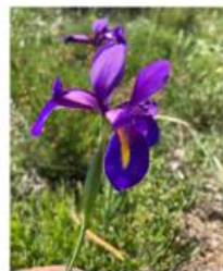
Lírio do Gerês ( Iris boissieri )