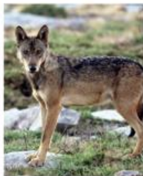
Lobo-Ibérico ( Canis lupus signatus )