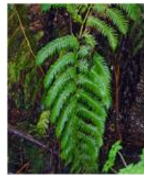
Feto do Gerês ( Culcita macrocarpa )