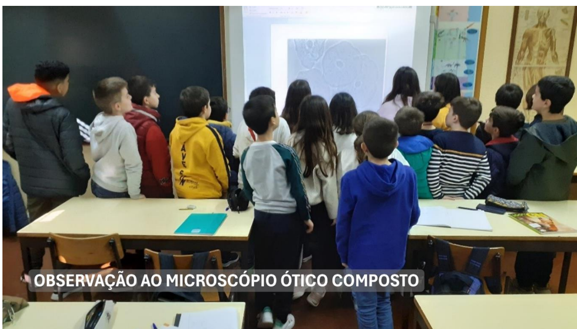
OBSERVAÇÃO AO MICROSCÓPIO ÓTICO COMPOSTO