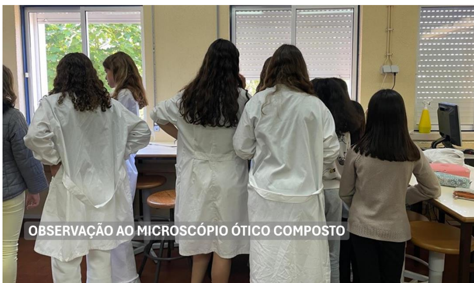
OBSERVAÇÃO AO MICROSCÓPIO ÓTICO COMPOSTO