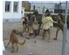
Ir ou não ir... Eis a questão (Feira Mix de 1999)