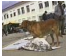
A marca indelével de um grande artista (Feira Mix de 1999)