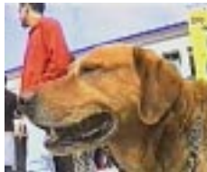
A Concentração antes do espectáculo (Feira Mix de 1999)

De improviso, e apenas porque lhe apetece, participa em peças de teatro da escola, ou em acontecimentos que envolvam música e dança. ■